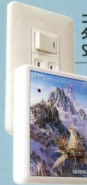
コンセント タイプ SKH049