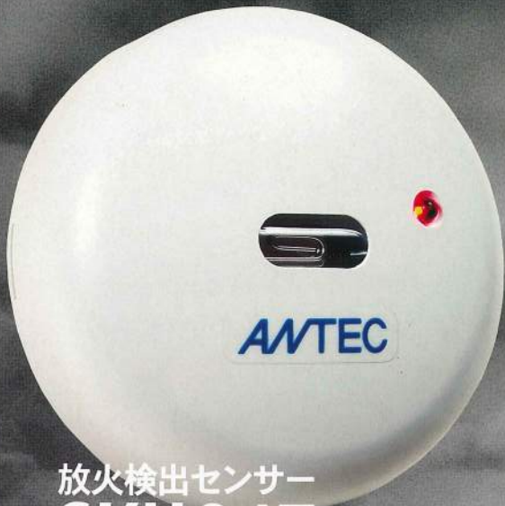
放火検出センサー SKH047 (屋外・屋内両用)