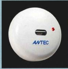
標準 タイプ SKH047