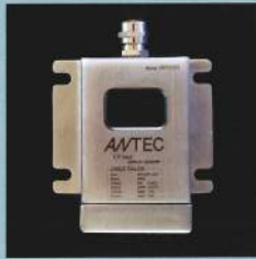
重機用 センサー SKH086