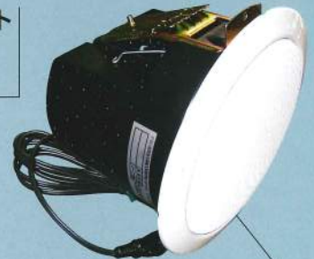
スピーカー内蔵タイプ SKH073