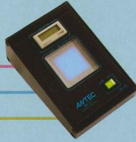
受信機(有線タイプ) SKH096