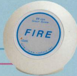
受信機(無線タイプ) SKH086R