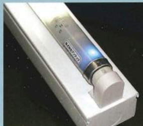
センサー内蔵型 LED蛍光灯 SKH085